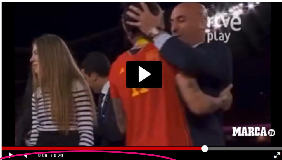
Rubiales repitió el beso de Casillas a Carbonero... ¡con Jenni Hermoso!

El presidente de la RFEF agarró la cara de la jugadora con las dos manos y le plantó un pico después de haberse fundido en un largo abrazo